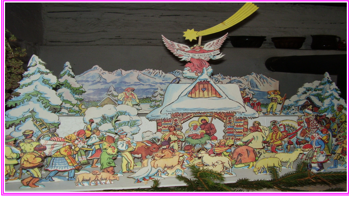
Betlémů tu bylo dost i rodiče koukali, ale nám se nejvíce líbil betlém z papíru