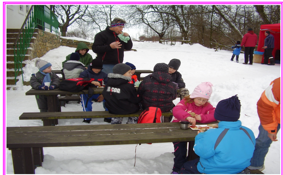
Po náročné prohlídce skoro všem vytrávil a tak nám nevadilo ani počasí, hlavně když klobáska byla teplá a dobrá